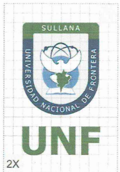
Espacio mínimo de seguridad