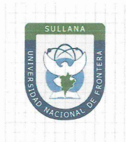
Tipo de Letra: Tahoma