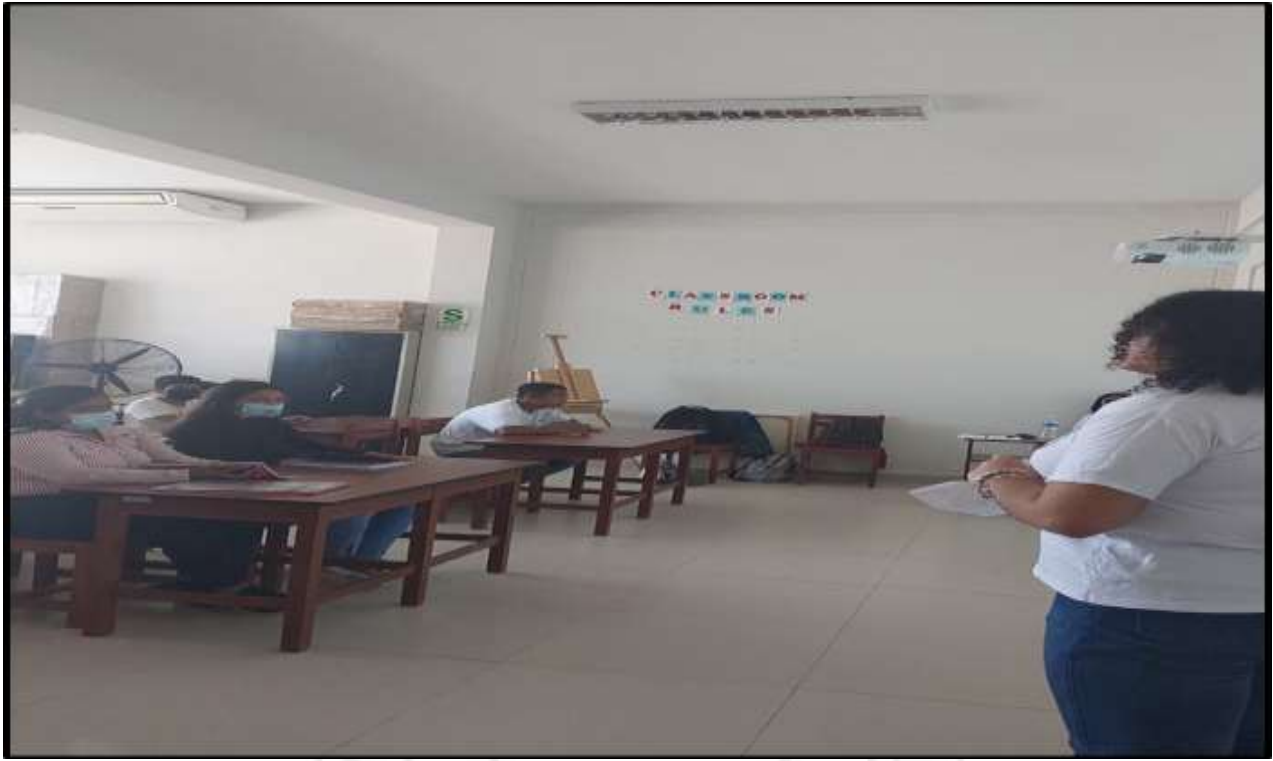
Figura N°02. Sesiones de clases con los niños, niñas y adolescentes en Situación de Calle y Riesgo Social.