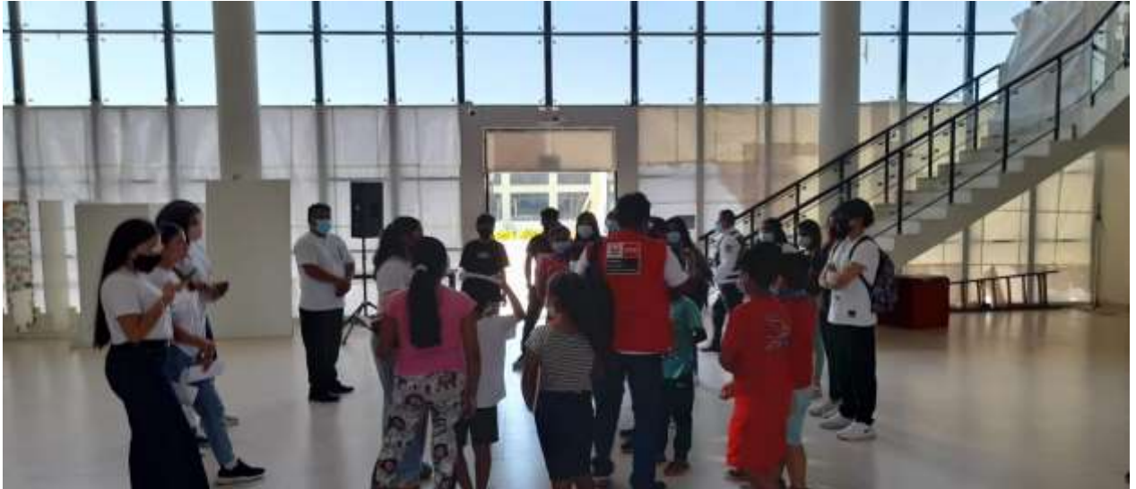
Figura N° 01. Bienvenida a los alumnos.