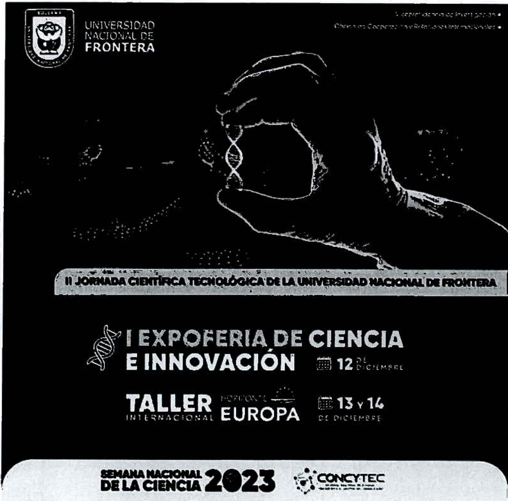
Fotografía 1. Afiche de difusión de la Jornada publicada en la página de Facebook de la UNF. https://www.facebook.com/photo/?fbid=3389849054416368&set=a.153341257339336